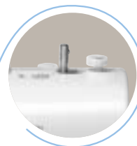
Bobinado de la Canilla Automático