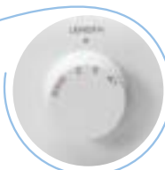
Ajuste de Largo de Puntada