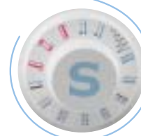
Fácil Selección de Puntadas