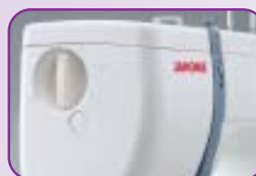
Pression du pied de biche réglable : Permet un entraînement régulier des tissus épais ou très fins et des tissus extensibles