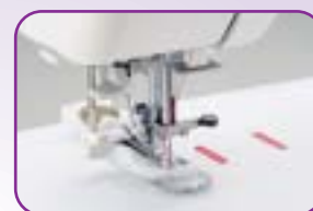
Boutonnière automatique en une phase à la taille du bouton , installez le à l'arrière du pied et réalisez une boutonnière impeccable en une seule opération