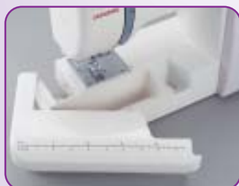
Table de couture avec les indications en inch et cm