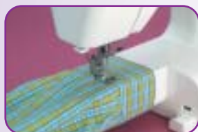
Bras libre pour les coutures circulaires (bas de pantalons manches...)