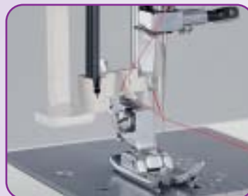
Enfilage automatique de l'aiguille