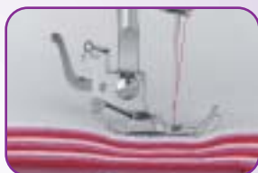
Couture dans les tissus épais grâce à la double hauteur du pied de biche et à la puissance de piqûre