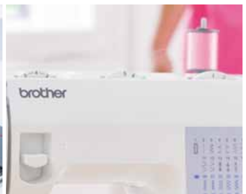
Enhebrado automático de aguja