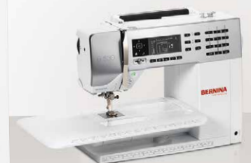
B 530 con mesa deslizante

La BERNINA 530 y la 550 QE están diseñadas para los futuros proyectos de costura que tiene en mente. Una gran variedad de accesorios y prensatelas se incluyen con la máquina. Encontrará una amplia gama de accesorios disponibles, cuando esté preparado para ampliar sus opciones. Sean cual sean las nuevas técnicas que desee explorar, encontrará los accesorios adecuados ayudarle a desarrollarse y expandir sus habilidades en la costura.